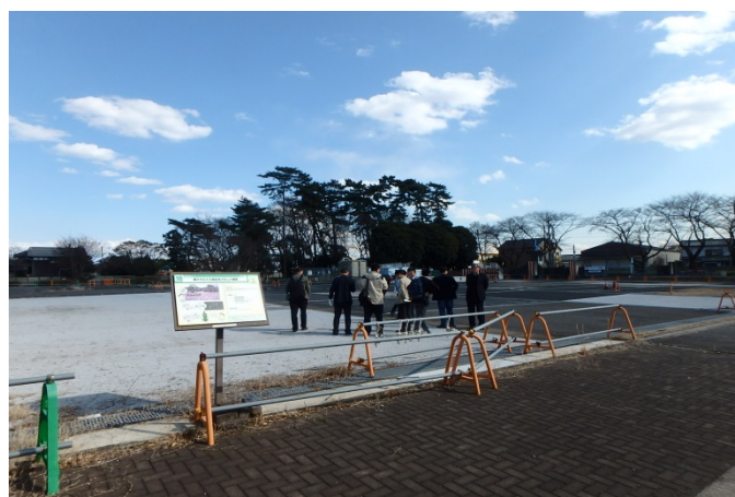
環境舗装フィールドの見学