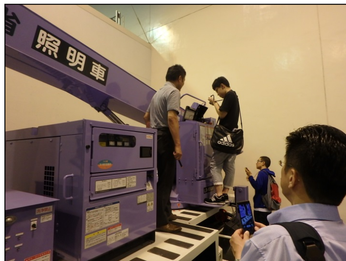
災害対策車両の見学