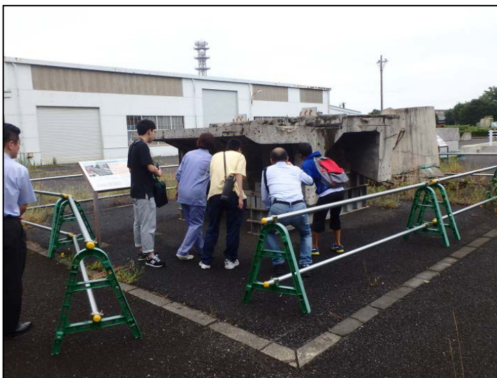
屋外展示場（旧跨線橋サンプル）の見学